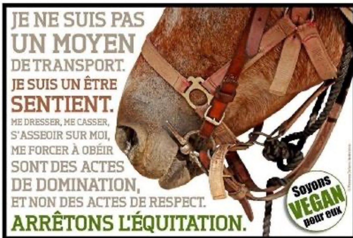
Figure 6 : communication issue d'internet, aujourd'hui difficile d'accès, archivée en 2021.

La figure 6 présente l'entrelac des sangles et autres cordes qui permettent de diriger, si ce n'est de contrôler le cheval. La tête du cheval ainsi harnachée convoque aisément l'imaginaire de la contrainte par corps. Avec la mise en relief dans ce visuel des caveçons, brides, rênes de bride, mors, etc. en cuirs, cordes ou en fer... le lien est proche avec les outils de torture qui ne lésinent pas sur ces matériaux. Le jeu des couleurs (du marron terreux virant au rouge sang) oriente le regard vers l'option privilégiée (en vert) : le véganisme proposé pour sortir définitivement de la contrainte sur l'animal, dont le cheval devient ici le parangon.