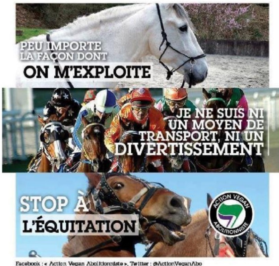
Figure 5 : communication issue du twitter Action Vegan Abolitionniste

naissantes et équestres en particulier (qui étaient et restent aujourd'hui l'objet de paris financiers), améliorant les capacités des chevaux (vitesse, endurance, résistance) en fonction des tâches qui leur étaient dévolues. Les pratiques dopantes ont aussi été testées chez les chevaux à la même période de la naissance des sports modernes... Le rendement devient le fer de lance axiologique des pratiques équestres les plus compétitives.