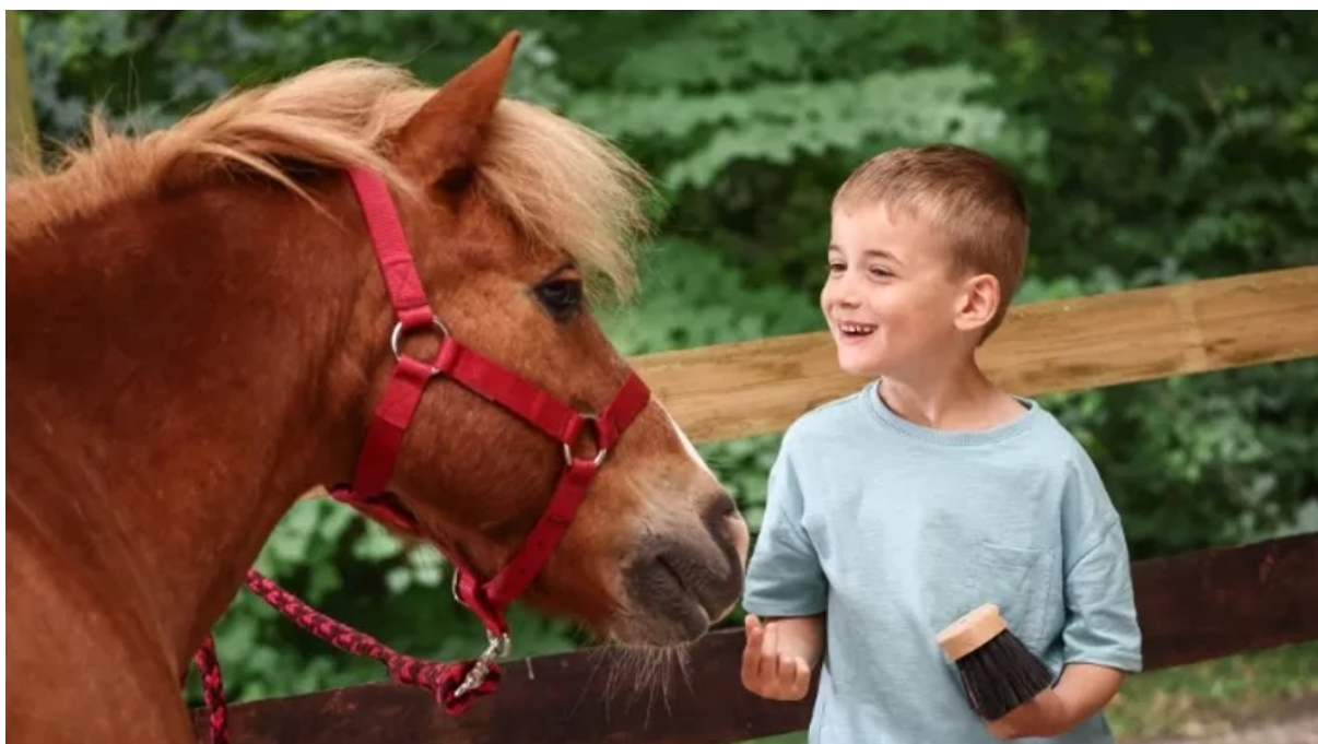
Figure 1 : « La pratique de l'équitation et le contact avec les poneys apportent de nombreux bienfaits dès l'enfance. » [26]

émises et qui leurs sont adressées par messages internétiques. Par conséquent, nous analyserons ces critiques pour ensuite questionner les réponses (ou absence de réponses !) des équitant·e·s. Pour ce faire, nous avons recensé depuis 2020 les images de communication utilisées sur internet. Elles sont définies comme des images traitées pour faire passer un message et se différencient des images choc publiées çà et là pour alerter l'opinion. Ces images sélectionnées sont celles dont l'usage a été suffisamment efficace pour qu'elles aient suscité une réutilisation par leurs opposants, et qu'elles soient produites par les entrepreneurs de la morale les plus connus ayant « pignon sur rue ». Ces créateurs et utilisateurs sont ACTA Gironde, Questions animalistes, 269 Life France, la Fédération nationale des conseils de chevaux (FCC) et PegazeBuzz. Les images de promotion de l'équitation sont pour leur part issues de la fédération française d'équitation (FFE), bien plus nombreuses, pour lesquelles nous ne retiendrons que deux exemples explicites témoignant de l'ensemble de la stratégie élaborée. La FFE a pour stratégie avérée de valoriser sa pratique, voire de centrer sa communication sur le versant relationnel, voire écologique. Ainsi, on peut voir par exemple des propositions insistant sur la « pureté » des relations anthropoéquinnes à travers l'imagerie de l'enfant tout sourire avec son partenaire équin :