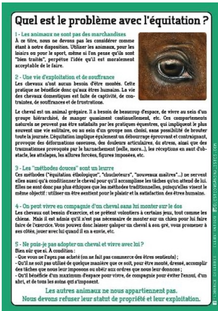
Figure 7 : illustration d'un article du site « questions animalistes » [35]

pratiques mais qui ne signe pas l'intégralité des modes d'interactions possibles en équitation. Ainsi, si le discours haineux n'est pas avéré dans les communications publiques, le vocabulaire utilisé laisse transparaître au moins le stigmate des actes reprochés aux cavaliers.