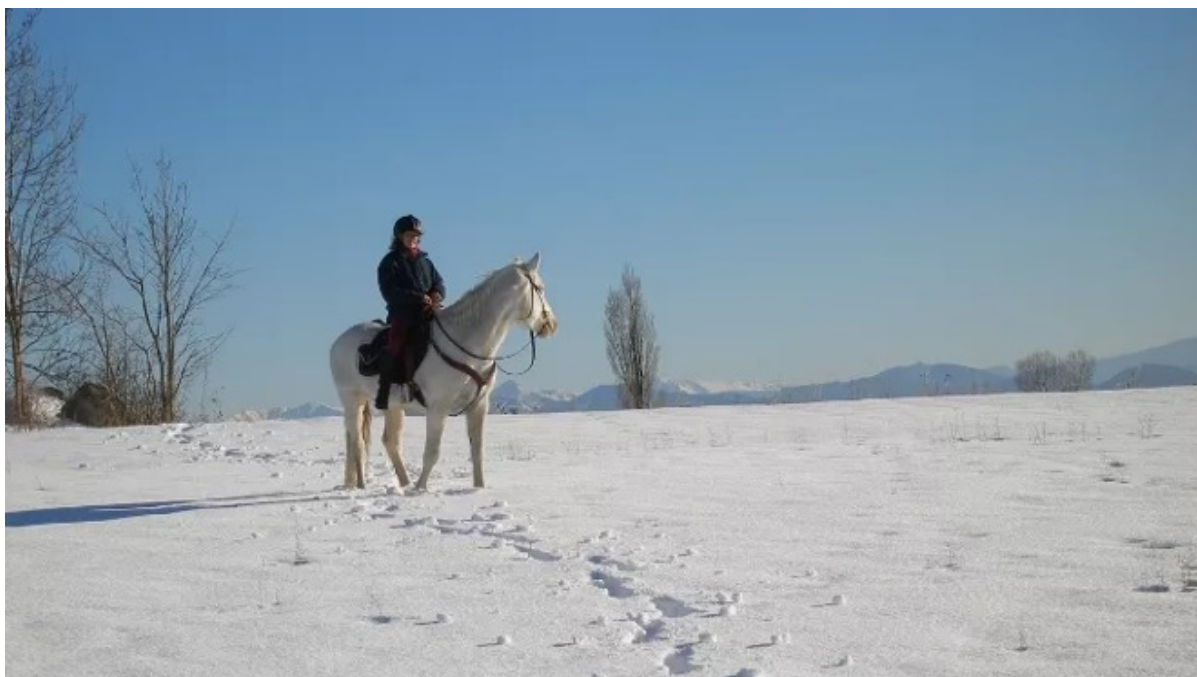
Figure 2 : « Profiter d'une randonnée équestre en montagne pour un Noël au sommet de la magie » [27]