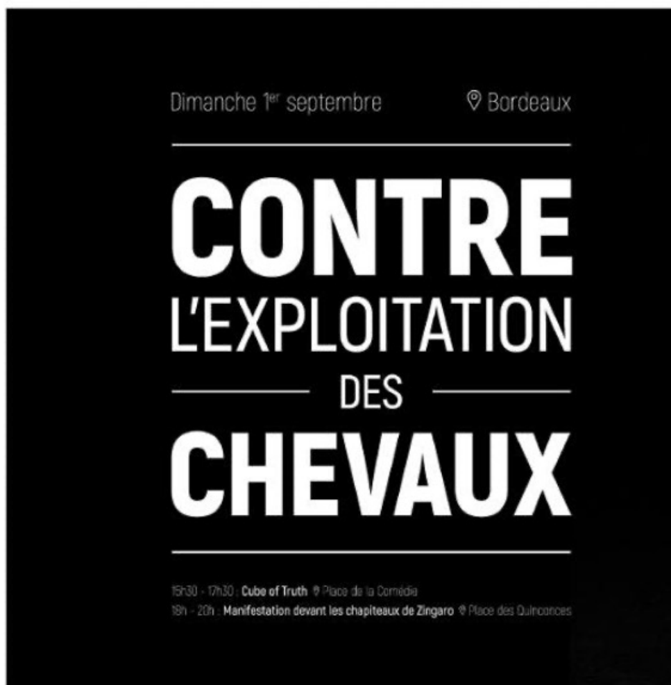
Figure 3 : communication issue des informations internetiques d'ACTA Gironde pour une manifestation en 2019

Si l'image est intéressante à étudier, elle ne peut l'être sans étudier en parallèle les termes employés dans ces mêmes publications. Les textes proposés invitent ainsi le spectateur au mépris des personnes qui ne pensent pas comme ceux qui produisent ces images :